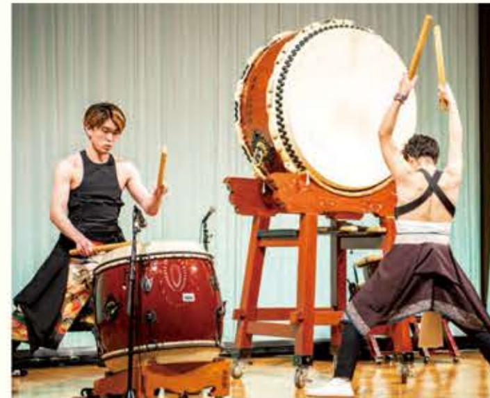
天皇盃 第30回大会記念演奏会 パチ・ホリック