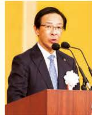
西脇 全国車いす駅伝競走大会実行委員会 会長 あいさつ