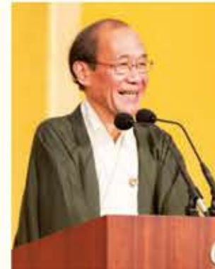
門川 京都市長 あいさつ