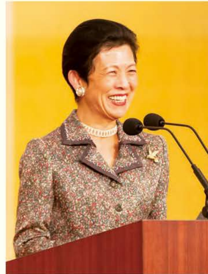
高円宮妃殿下おことば