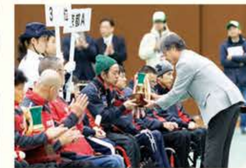
第3位 京都Aチーム 49分56秒