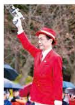
スターターは門川 京都市長