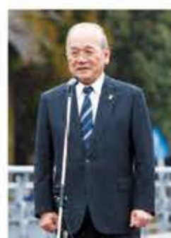
日本障がい者スポーツ協会 鳥原会長による競技開始宣言