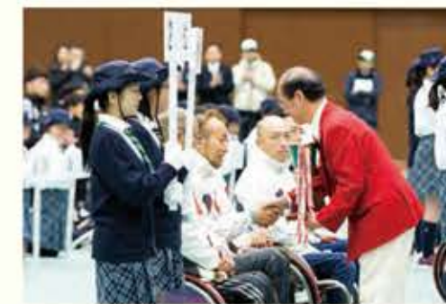
第2位 大分Aチーム 45分52秒