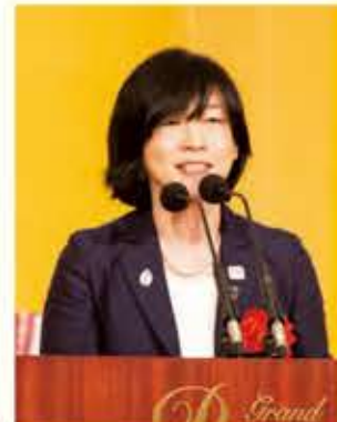
藤江 スポーツ庁審判官 あいさつ