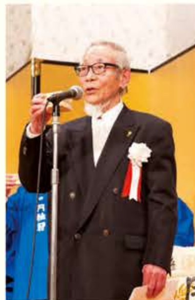
林 ユース21京都 監査 乾杯ご発声