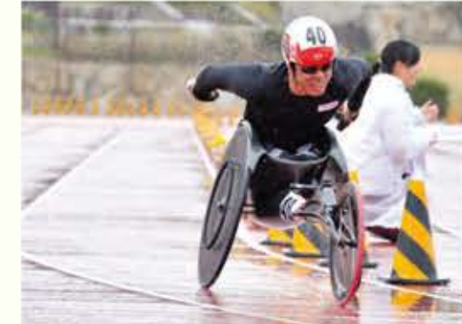
競技場でのラストスパート