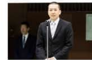
石川 ユース 21 京都 副理事長 閉会宣言